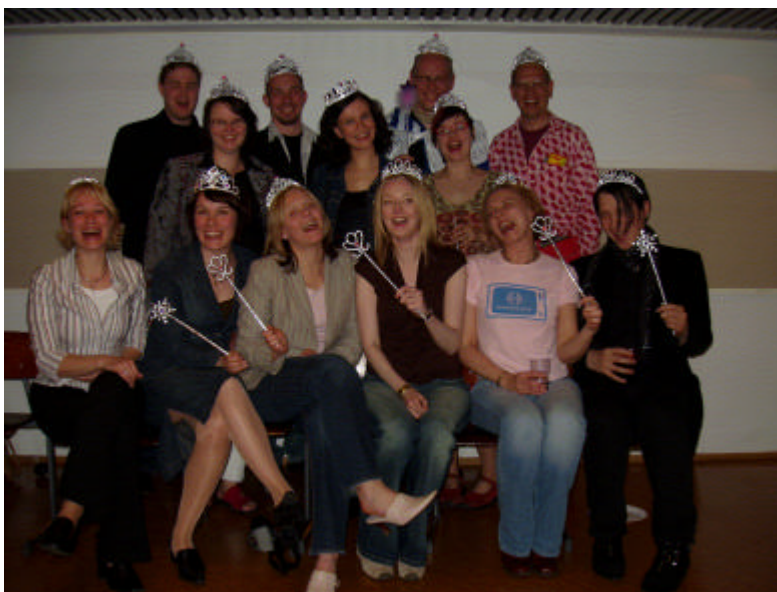
METKA-väki kruunattiin hankkeen päätöseminaarin iltajuhlissa.

Illalla vietettiin kutsuvierastilaisuus Oulun kaupungin Rockpolis-hankkeen tiloissa, jossa seminaarissa alkanutta verkostoitumista jatkettiin. Yhteistyössä oli mukana Visualway Design Oy.