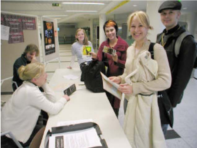
METKA-opiskelijoita tapahtumajärjestelyissä.