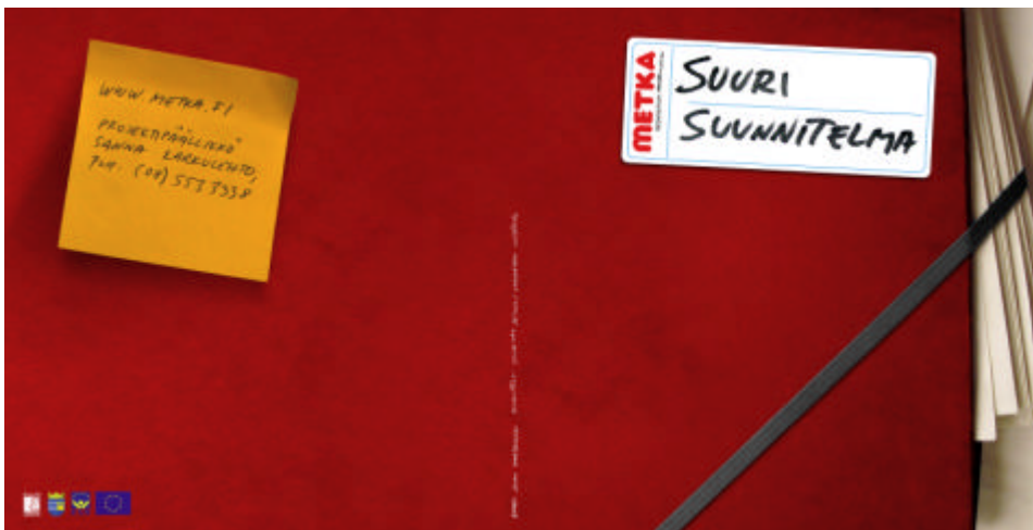
Ensimmäisessä METKA-esitteen kansiluonnoksessa METKA-slogan oli vielä "Suuri suunnitelma". Slogan muutettiin lopullisessa versiossa muotoon "Tulevaisuuden tuottajat".

METKA-hankkeessa ulkoisella ja sisäisellä tiedottamisella on ollut suuri rooli. Hankkeen alussa laadittiin oma tiedotussuunnitelma yhdessä Oulun yliopiston viestintäpalvelujen kanssa. Tiedotussuunnitelman toteuttamista jatkettiin yhteistyössä viestintäpalvelujen kanssa koko hankkeen ajan. Projektille laaditussa tiedotussuunnitelmassa huomioitiin muun muassa alan yritykset, tiedotusvälineet, alueiden asukkaat, sisältötuottajat, alueen organisaatiot (av-ala), yliopistot ja muut oppilaitokset sekä muut sidosryhmät.