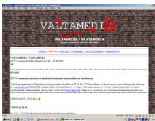
METKA-hankkeen ensimmäiset www-sivut julkistettiin opiskelijahaun yhteydessä. Vuonna 2003 KUTU-seminaarin yhteyteen laadittiin seminaarin oman www-sivut .