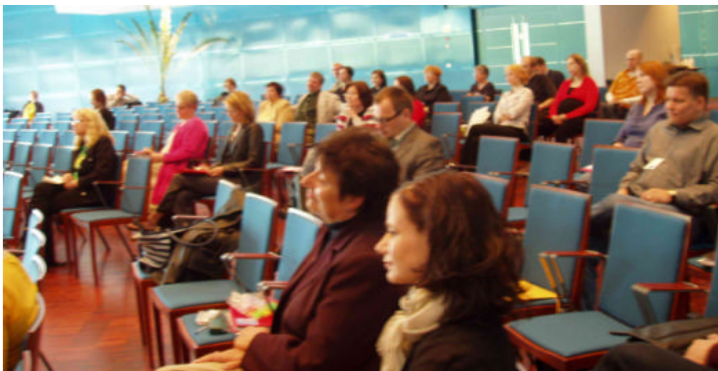
METKAN päätösseminaari Saalastinsalissa.

Päättävä METKA-hanke ja vuoden alussa startannut CreaM-hanke järjestivät 9.6.2005 Oulun yliopiston Saalastinsalissa seminaarin, jonka tarkoituksena oli juhlistaa METKasta valmistuneita mediatuottajamaistereita sekä antaa alkusysäys CreaM-hanketta (Creative Processes and Content Business Management) läheisesti koskettavien aiheiden keskustelulle. Seminaariin osallistui päivän aikana 75 kuulijaa Oulun seudulta ja muualta Suomesta. Seminaarissa olivat esillä muun muassa sellaiset teemat kuin luovuus, johtajuus ja tulevaisuus. Seminaari kantoi nimeä "Kerro kerro kuvastin..." Luovuus ja innovaatiot media- ja sisältöalan murroksessa.