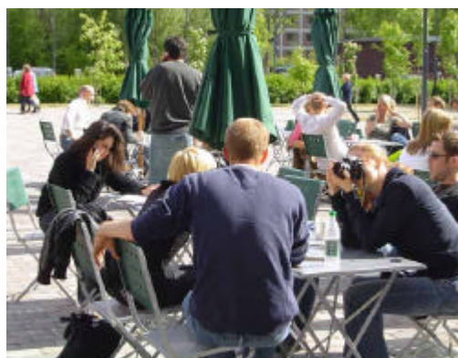
Alan ammattilaisille tarjottiin mahdollisuus osallistua EAVEn yleisöluennoille ja elokuvanäytöksiin.