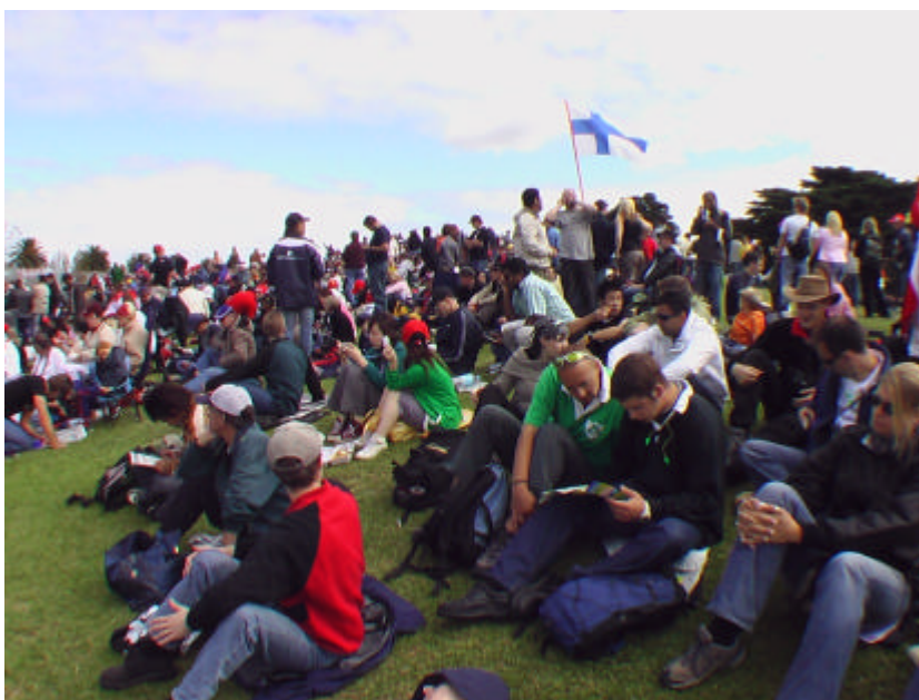
Suomalaista näkyvyyttä Australiassa.

METKAN projektipäällikkö toimi Oulun yliopiston Kansainvälisten asioiden yksikön nimittämänä mediatuottajan maisteriohjelman kansainvälisten asioiden koordinaattorina taideaineiden ja antropologian laitoksessa. METKA-hankkeen aikana taideaineiden ja antropologian laitokselle laadittiin kaksi uutta kansainvälistä opiskelija- ja opettajavaihto-ohjelmaa kahteen eurooppalaiseen yliopistoon: 1) University of Maltalle ja 2) University of Århusiin Tanskaan.