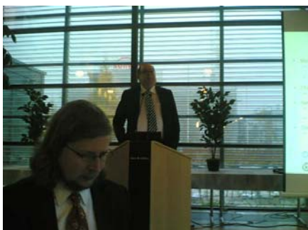
HBB:n esiintyjä 30.9.2005 Technopoliksessa