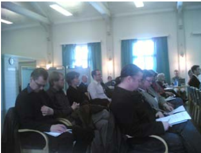
Media-alan osaamistapahtuman yleisöä 21.5.2005