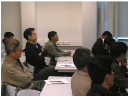
Eteläkorealaiset vieraat Oulun yliopistossa

Toimenpiteet 2005: Kansainvälinen ja valtakunnallinen verkostoituminen on ollut vuoden aikana aktiivista. Hanke on järjestänyt seitsemän valtakunnallista/kansainvälistä seminaaria ja osallistunut useisiin. Kansainvälisestä yhteistyöstä esimerkkinä mainittakoon yhteistyösopimus Kanadan suurimman media-alan oppilaitoksen Ontario College of Art and Designin kanssa. Lisäksi yhteistyöneuvotteluja on käyty For.comin, International Consortium for Media, Communication and Cultural Studies Joint Degree -ohjelman sekä Århusin ja Middlesexin yliopistojen kanssa. Kansainvälisiä vieraita on käynyt mm. British Telecomista ja Etelä-Korean media-alan oppilaitoksista.